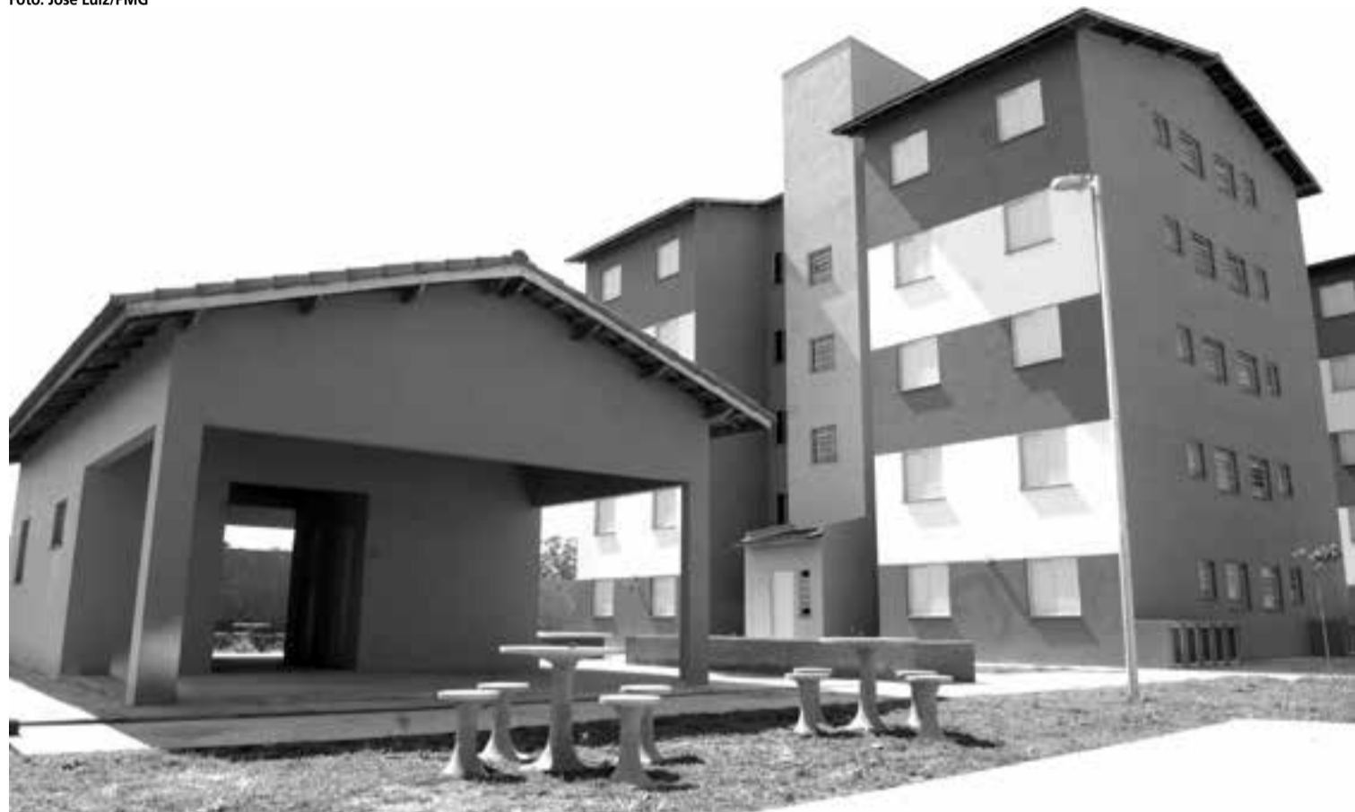
Unidades do conjunto habitacional têm em torno de 45 m 2 e contemplam famílias que vivem em favela na rua Joaquina de Jesus

tregue em setembro: 500 unidades do Conjunto Residencial Esplanada, no bairro do Pimentas. O empreendimento beneficiou moradores de sete regiões do município: Jardim Novo Portugal, Vila Any, Vila Rio, Lenize, Cocho Velho, Taboão e Jardim Cidade