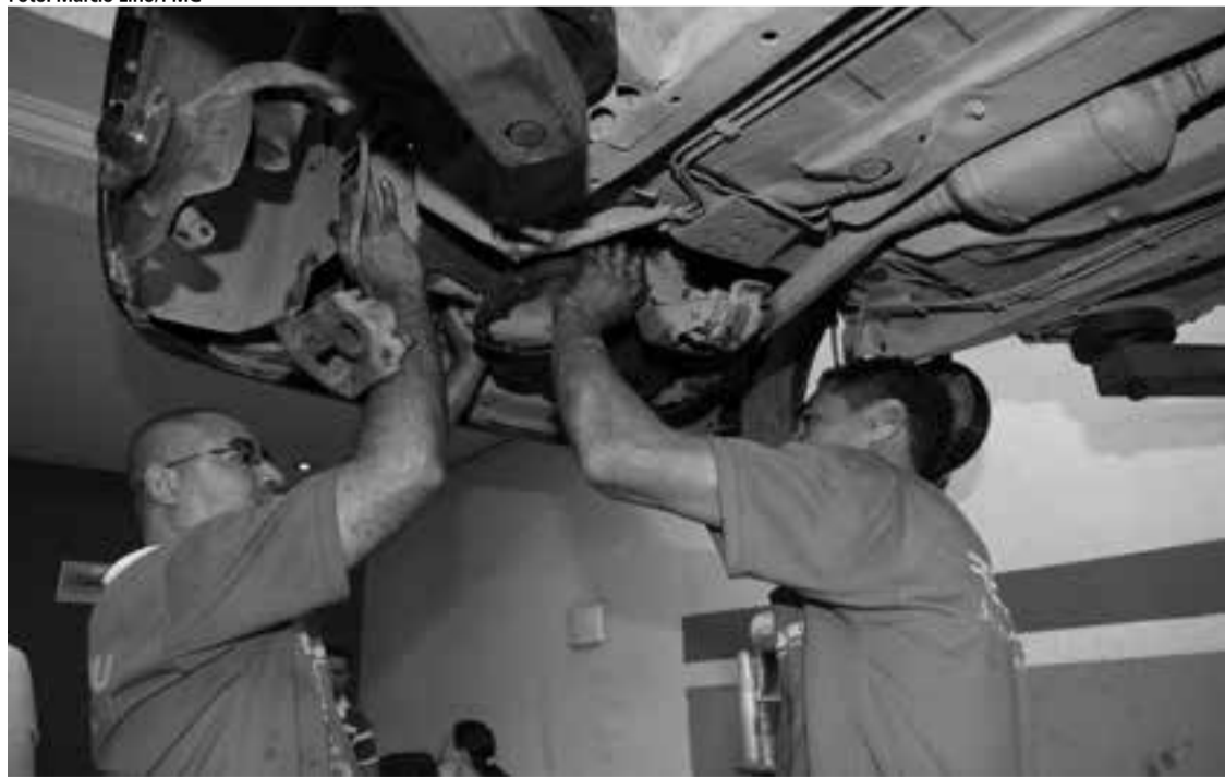
Setor de serviços permanece na liderança e é o que concentra o maior número de vagas geradas