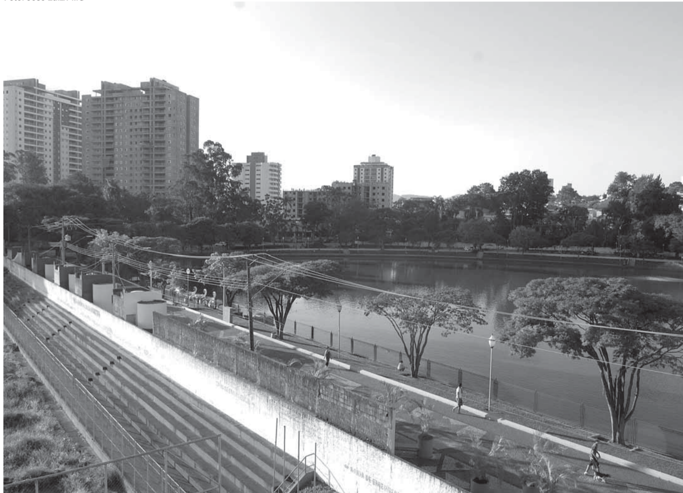
▶ Intervenção deve eliminar os problemas causados pela chuva em vários pontos da região, incluindo o Lago dos Patos