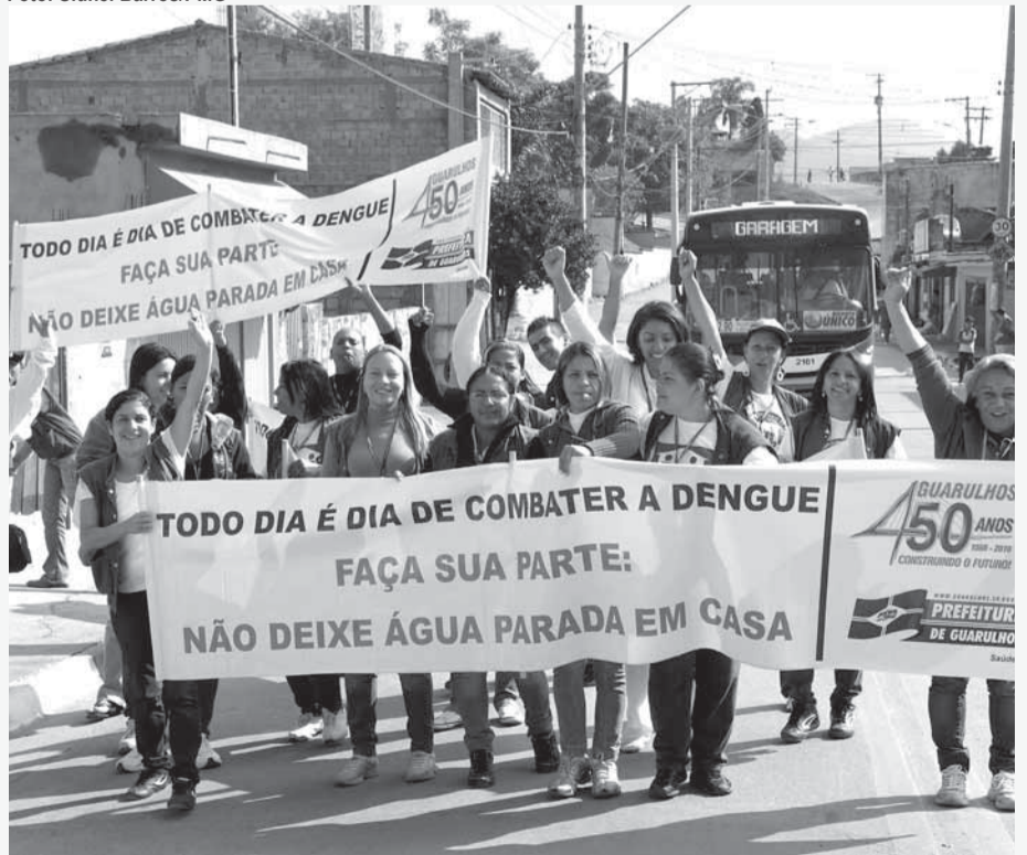
▶ Objetivo é ampliar o trabalho de casa em casa e visitar pontos estratégicos