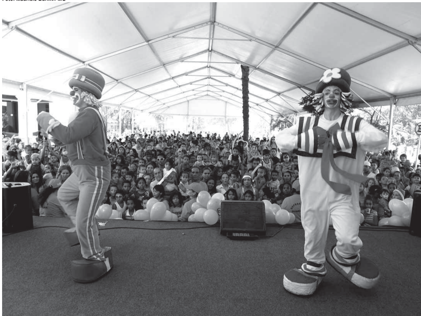
▶ Show dos palhaços Patati e Patatá Cover e diversas outras atrações ajudaram a animar a criançada no domingo