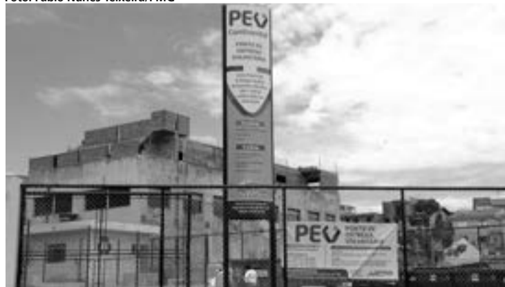
Guarulhos possui 17 PEVs, que funcionam de segunda a sábado

públicos. Os reciclados são encaminhados para a cooperativa, para geração de emprego e renda. Já as madeiras e os pneus são enviados para recicladoras particulares de cada um dos setores.