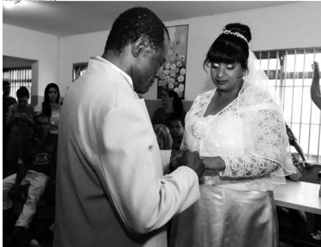
Ações da Prefeitura com a população de rua buscam restabelecer a autoestima e os vínculos sociais

está pronto para iniciar uma nova vida ao lado da noiva.