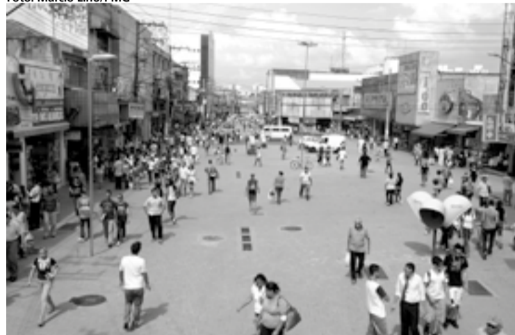
Em Guarulhos, a população de negros e de pardos chega a 45%

titucional e eliminá-lo. Esse se manifesta por meio de normas, práticas e comportamentos discriminatórios adotados no cotidiano de trabalho.