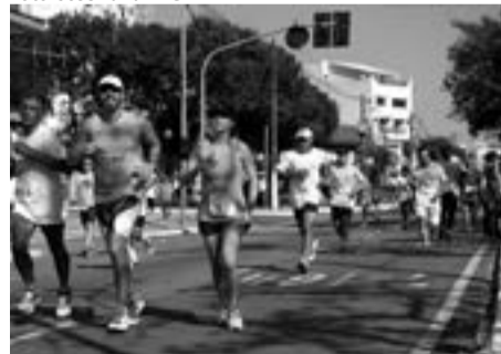
A prova será no dia 20 de dezembro

para o campeão e a campeã dos 10K Geral, no valor de mil reais, sendo que haverá premiação até o 10º colocado. Já para os residentes em Guarulhos, a premiação será até o 5º lugar, com os campeões recebendo R$ 600.