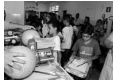
Muita emoção na festa com Papai Noel

Vila Operária vai recepcionar o bom velhinho no campo de futebol da rua Dourado, enquanto, a partir das 14 horas, será a vez da meninada de Cumbica, na rua Fumagali.