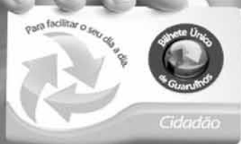
Terminal Urbano São João

A Prefeitura de Guarulhos vem transformando o transporte público com mais segurança, comodidade e economia. O Bilhete Único já beneficia cerca de 540 mil pessoas, que podem fazer até quatro integrações no período de duas horas pagando apenas uma passagem. E para facilitar o acesso à maior quantidade de linhas de ônibus, já foram entregues o Terminal de Transferência Bonsucesso, a nova rodoviária e três novos terminais urbanos: Cecap, Pimentas e São João. Iniciativas como essas fazem mais do que melhorar a mobilidade urbana. Elas direcionam o sistema de transportes para o futuro que Guarulhos precisa.