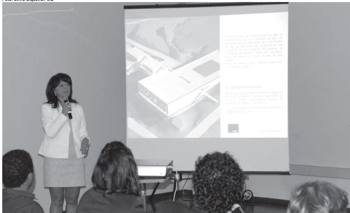
► Projeto inovador foi apresentado nesta quinta-feira (27), em evento realizado no auditório do Paço Municipal

no prédio, ao mesmo tempo em que um sistema de aquecimento natural melhorará a temperatura e evitará a utilização de energia elétrica nas salas de aula.