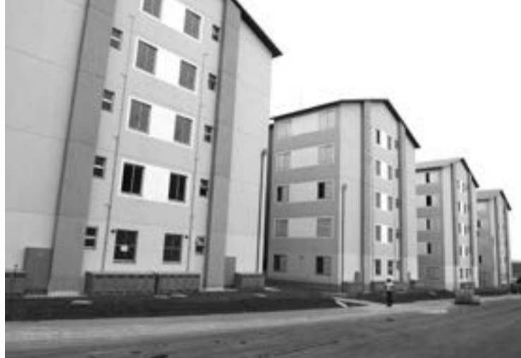
O programa atende famílias com renda de até R$ 1.600,00

alegadas. No caso de renda, apresentar holerite de todos os membros da família declarados no programa, cuja soma não ultrapasse R$ 1.600,00 mensais. Se tiver sido inabilitado por não ser morador de Guarulhos, é necessário apresentar comprovante de endereço (conta de água, luz ou telefone) em nome do cadastrado. Se a inabilitação se deve a ter sido beneficiado em algum programa habitacional, deverá ser apresentado um requerimento para análise da Secretaria de Habitação.