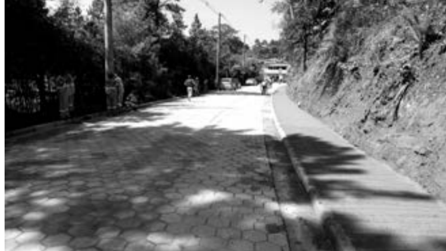
A avenida Guanabara recebeu uma série de melhorias

implantar sinalização de trânsito na avenida Guanabara. Equipes da pasta tem se reunido com os moradores do Água Azul para discutir os impactos dessas obras na localidade.