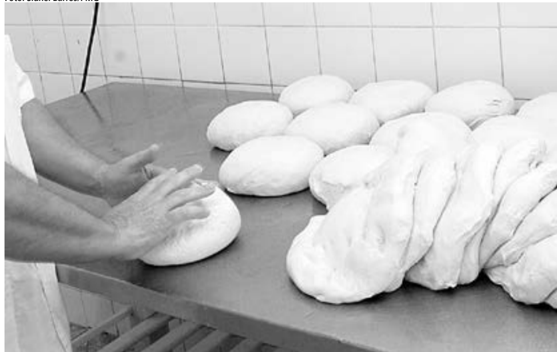
Curso de Boas Práticas em Manipulação de Alimentos será exigido para obtenção de alvará sanitário