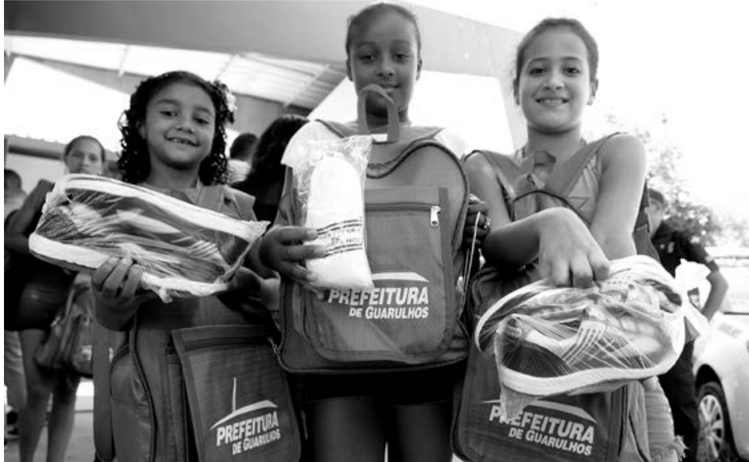
Contentes: estudantes da Escola da Prefeitura Dolores Gilabel Hernandes Pompeo receberam o kit escolar na quinta-feira, dia 26

uniforme é composto por camiseta, calça, saia para as meninas, blusa e tênis.