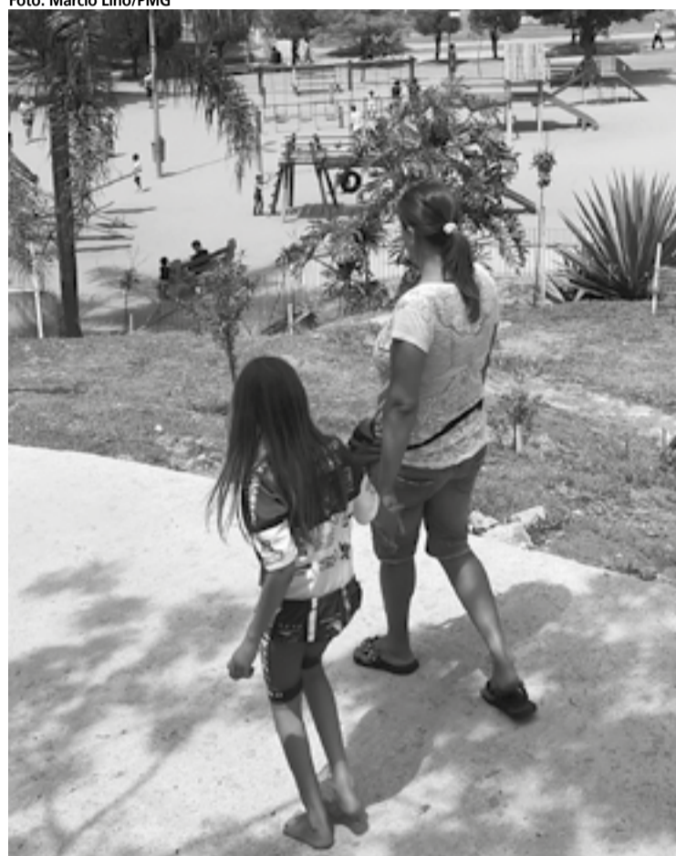
No caso de ex-mulher, a pensão cessa após novo casamento

O filho perde o direito à pensão alimentícia quando se casar, se emancipar em cartório ou completar 18 anos. No caso de estar na faculdade, a pensão pode se estender até os 24 anos. O benefício só persiste se o filho for inválido ou incapaz. No caso de ex-mulheres ou ex-maridos, a pensão cessa após novo casamento, se conseguir um emprego ou se for beneficiado por qualquer outra situação que altere a condição de vida, de modo que não precise mais do benefício.