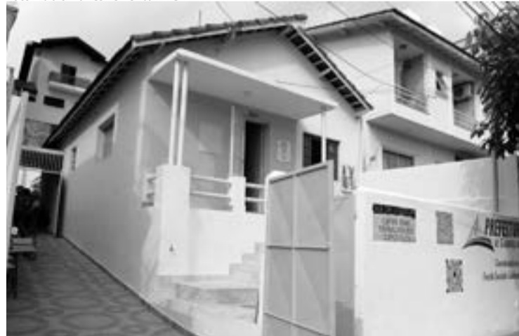
A unidade fica na rua Conde Francisco Matarazzo, 191

Rosas, Margaridas e Betes, e o Centro de Terapias. Após adequações, o local apresenta as condições necessárias para abarcar a Casa da Trabalhadora Doméstica.