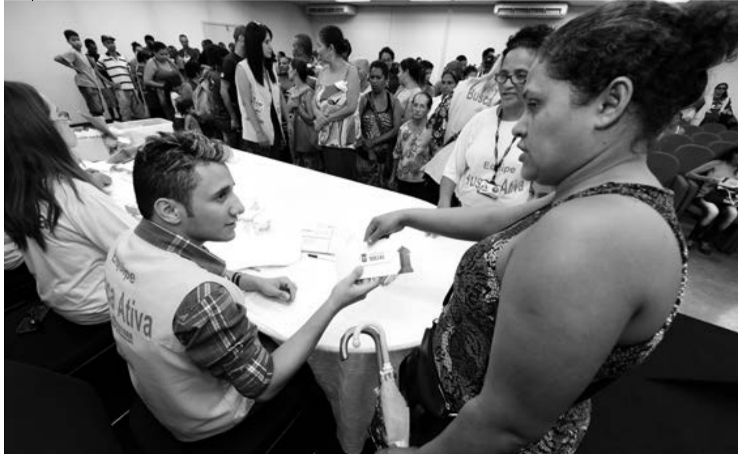
Durante o lançamento no auditório do Paço Municipal equipes da Prefeitura distribuíram o novo cartão para várias famílias

identificar em quais deles a pessoa ou a família se enquadra, ampliando assim o número de beneficiados na cidade.