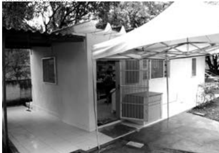
Novo espaço ajuda na reabilitação e também na geração de renda

da cozinha experimental as pessoas atendidas pelas equipes do Consultório na Rua.