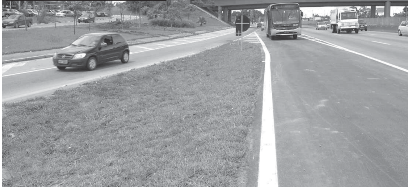
▶ Assim que o novo acesso na Via Dutra foi aberto, o efeito foi imediato com o descongestionamento do trânsito