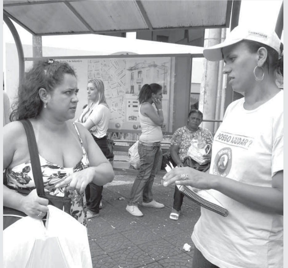
▶ Cerca de 300 orientadores atuam em todas as regiões da cidade