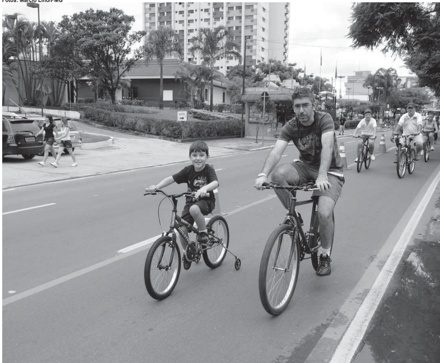
▶ Com extensão de 6.900 metros, Ciclovía passou a contar com duas horas a mais de funcionamento em fevereiro