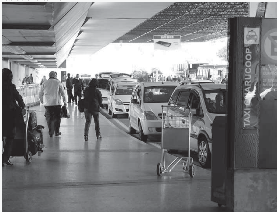
▶ Inicialmente serão preenchidas 80 das 133 vagas criadas pela Prefeitura