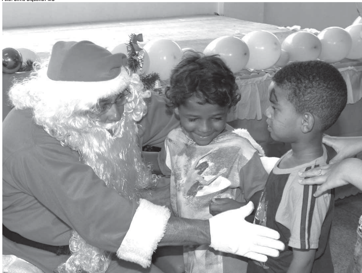
► Além de garantir um Natal melhor para as crianças, campanha contribui com o comércio e estimula o consumo