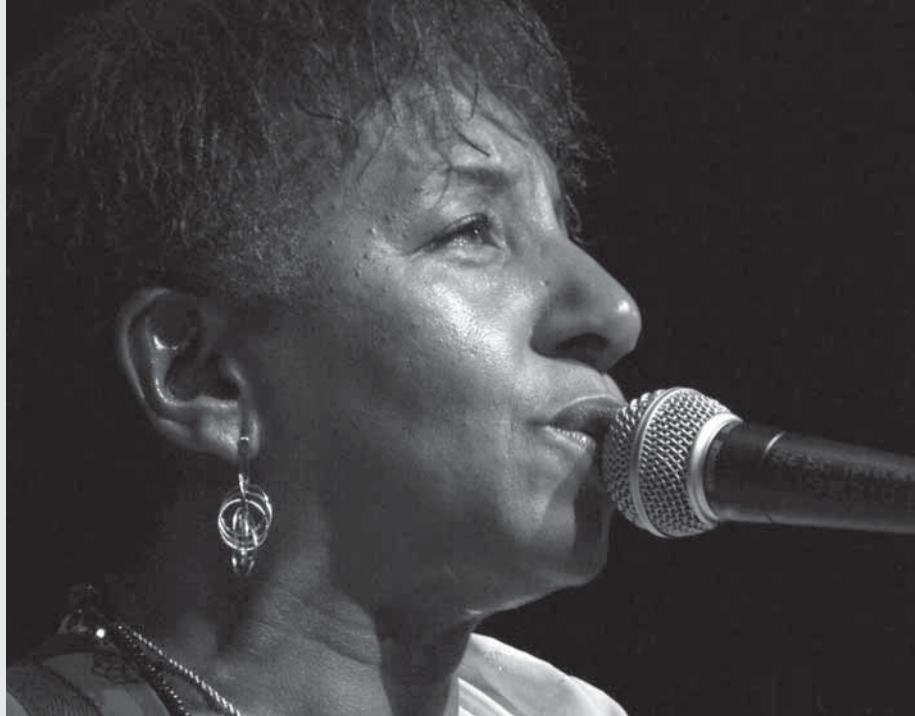
▶ Apresentação acontece no próximo dia 20, no Adamastor Centro