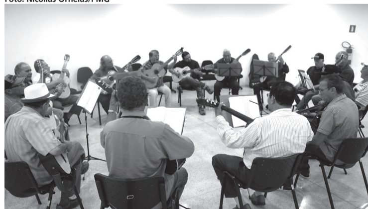
A Orquestra de Violeiros nasceu de uma ideia de Tonico e Tinoco

jetória da Música Raiz na Cidade de Guarulhos, organizada pelo Arquivo Histórico Municipal, o ápice da música caipira no município veio com a criação da Associação Guarulhense dos Artistas Sertanejos (Agas), em 1977. Com o apoio de Tonico e Tinoco, os artistas locais ganharam notoriedade nacional.