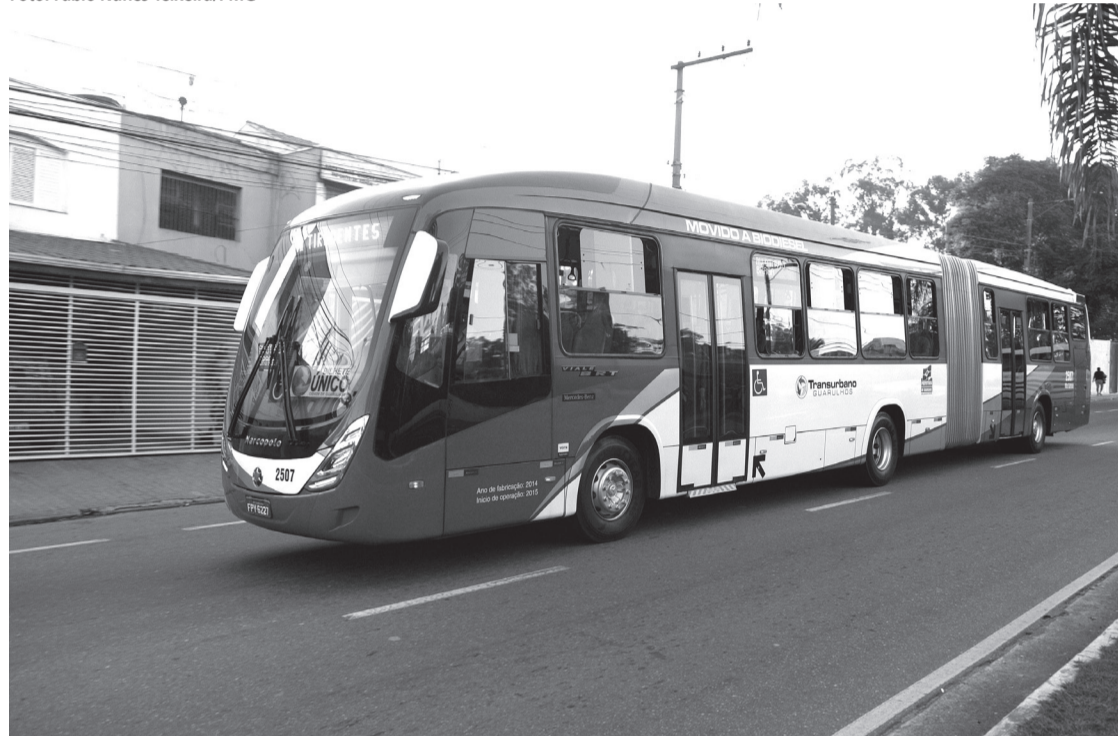
Com os ônibus de maior capacidade de transporte de passageiros, algumas linhas foram alteradas

João/Terminal Vila Galvão saiu e entrou a 264 - Terminal Vila Galvão/Centro - via alameda Yayá. Para quem vem do Terminal São João com destino à Vila Galvão poderá usar a linha 433 - Terminal São João/Vila Galvão - via Anel Viário ou usar a 453 - Terminal São João/Centro (via Tiradentes), integrando com a linha 264 no segundo ponto da av. Salgado Filho. Quem vem no sentido oposto, da Vila Galvão para o Termi-